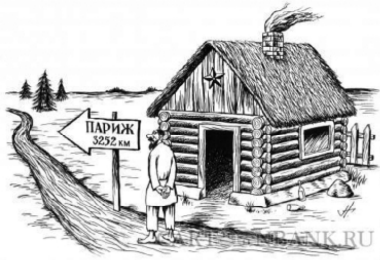
Так и до «Парижской провинции» недалеко...

От редакции: «Городская газета» приглашает к дискуссии на эту актуальную тему жителей города и района.