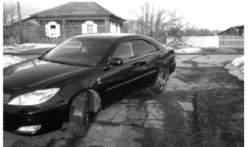
Toyota Camry - управляй мечтой!

- значит выбирать можно начиная с «Новая Toyota Camry 2.5 АКПП Комфорт» - 1 004 000 руб. Вроде вполне хорошо. Сейчас только надо посмотреть по остальным пунктам требований. Эх... Комфорт нам не подходит. Нет поставки с кожаным салоном... А нам надо... Следовательно, надо брать «Новая Toyota Camry 2.5 6АТ Элеганс» - 1 100 000 руб!!! Вроде полностью попадает под описание! Попадает? Да нет... Опять не подходит... Нам же диски нужны 17-дюймовые. А на Элегант ставят только 16 дюймов. Благо есть Элегант плюс! «Новая