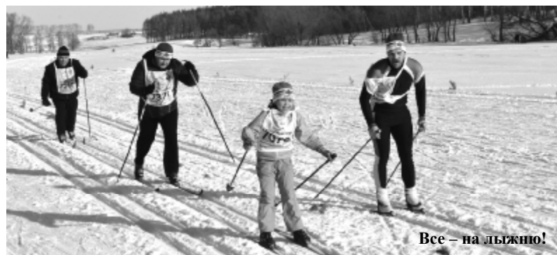
Все - на лыжню!

не проводится, к нам приезжают спортсмены из Починковского, Шатковского и других районов юга области и даже из Мордовии. Особенностью лыжных гонок-2013 стало участие в них не только учащихся учебных и спортивных заведений, но и представителей многих учреждений города и района во главе со своими руководителями. 72 победителя было отмечено в 25 номинациях и возрастных группах, все они получили грамоты, а также «золотые», «серебряные» и «бронзовые» медали.